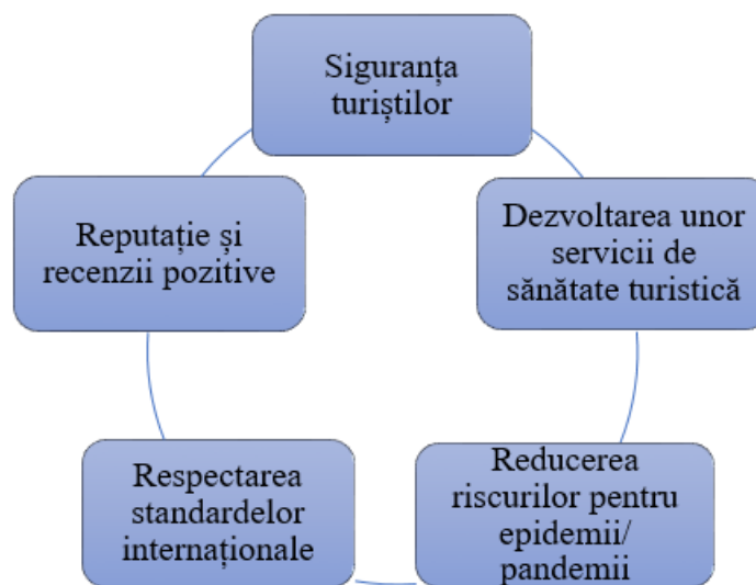
Figura 4. Aspecte ale Sănătății și Igienei care contribuie la sporirea competitivității turismului.

În acest context, sănătatea și igiena contribuie la sporirea competitivității sectorului turistic prin aspectele prezentate în figura 4.