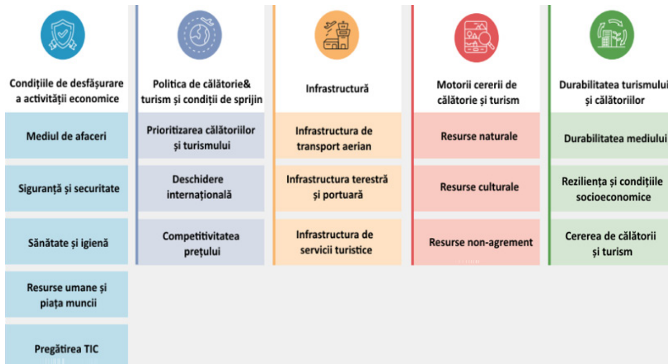
Fig. 1. Componentele Indicelui de Dezvoltare a Călătoriilor și Turismului, 2021.