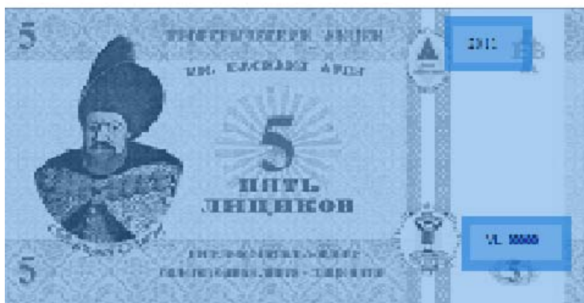
Фото. Образец лицейской валюты, автор Сорокин А., выпускник лицея 2013/2014 учебного года

Все вышеописанное красноречиво свидетельствует о совмещении приятного, т.е. игры, с полезным – учебной деятельностью.