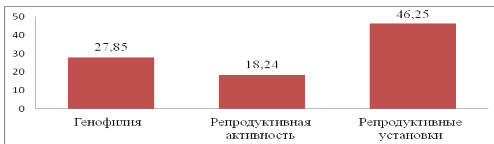
Рис.1. Средние показатели компонентов репродуктивных установок.

Полученные данные позволяют констатировать, что молодые женщины проявляют любовь к детям и отмечают, что потенциально хотели бы иметь детей, однако показатели репродуктивной активности указывают, что они пока не готовы предпринимать какие-либо действия для того, чтобы становиться матерями.