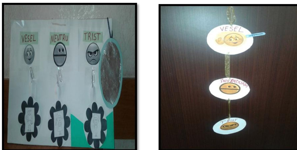
Fig.3. Panouri Dispoziția mea .

Panoul Dispoziția mea poate fi confecționat divers: putem utiliza pozele copiilor pentru a-i ajuta să poziționeze în panou informația individuală cu privire la dispoziția personală. Putem utiliza clești pe care sunt prinse pozele copiilor, acest element fiind prins de semnul ce indică de fapt dispoziția copilului (Fig.3).