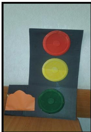
Fig.2. Panoul Semaforul succesului .

Acest panou (Fig.2) poate fi confecționat dintr-o bucată de carton și trei farfurii de unică folosință, pe care le colorăm în roșu, verde și galben. Pentru activitatea la acest panou vom avea nevoie de bețișoare colorate în aceleași culori sau fișe. Panoul poate fi utilizat în cadrul etapei Reflecție, când copiii se autoapreciază. Culoarea verde ar însemna că am fost foarte activ azi la activitate, am răspuns foarte bine la întrebări; culoarea galbenă – am fost activ, am răspuns bine la întrebări; culoarea roșie – este loc de mai bine, data viitoare voi fi mai activ, voi răspunde mai bine la întrebări. În partea de jos a panoului am fixat un buzunar, în care copiii pot să plaseze bețișoarele sau jetoanele, în caz că nu s-au determinat sau nu doresc azi să participe la autoapreciere.