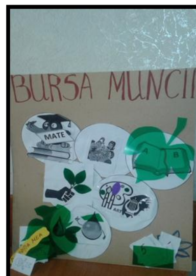
Fig.4. Panoul Bursa muncii.