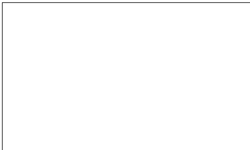
Fig. 1. Nivelul competenței de evaluare formativă la cadrele didactice universitare la etapa de constatare.

În baza rezultatelor obținute se constată că 83% din respondenți consideră că evaluarea formativă este foarte importantă în procesul educațional, 12% evidențiază faptul că evaluarea formativă este mai puțin importantă și 5% din respondenți consideră că evaluarea formativă nu este importantă. Prin urmare, majoritatea cadrelor didactice (83%) susțin importanța evaluării formative în procesul educațional (Figura 2).