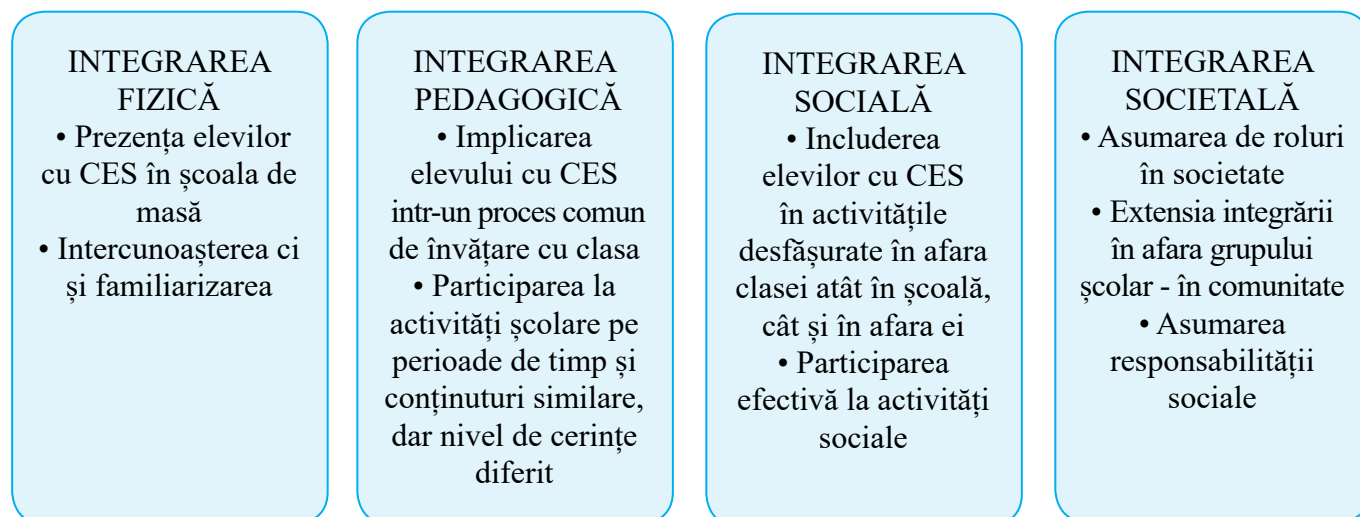
Fig. 1. Etapele integrării elevilor cu CES.

Cele patru niveluri ale integrării nu se desfășoară și se realizează separat, ci se află în relații de interdependență – subliniem că absența unei etape afectează socializarea propriu-zisă.