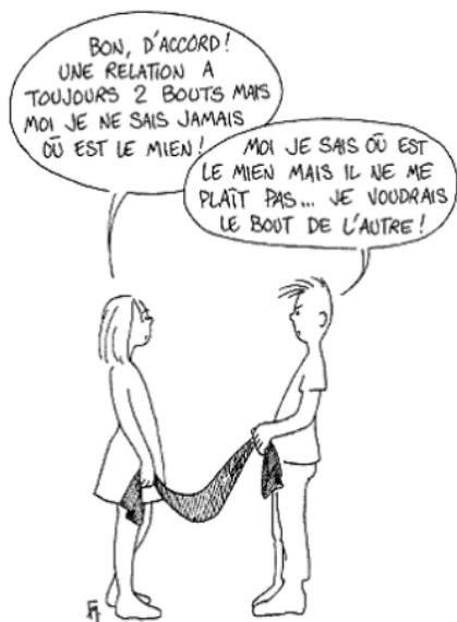
Fig. 1. Comunicare relațională prin Metoda ESPERE.