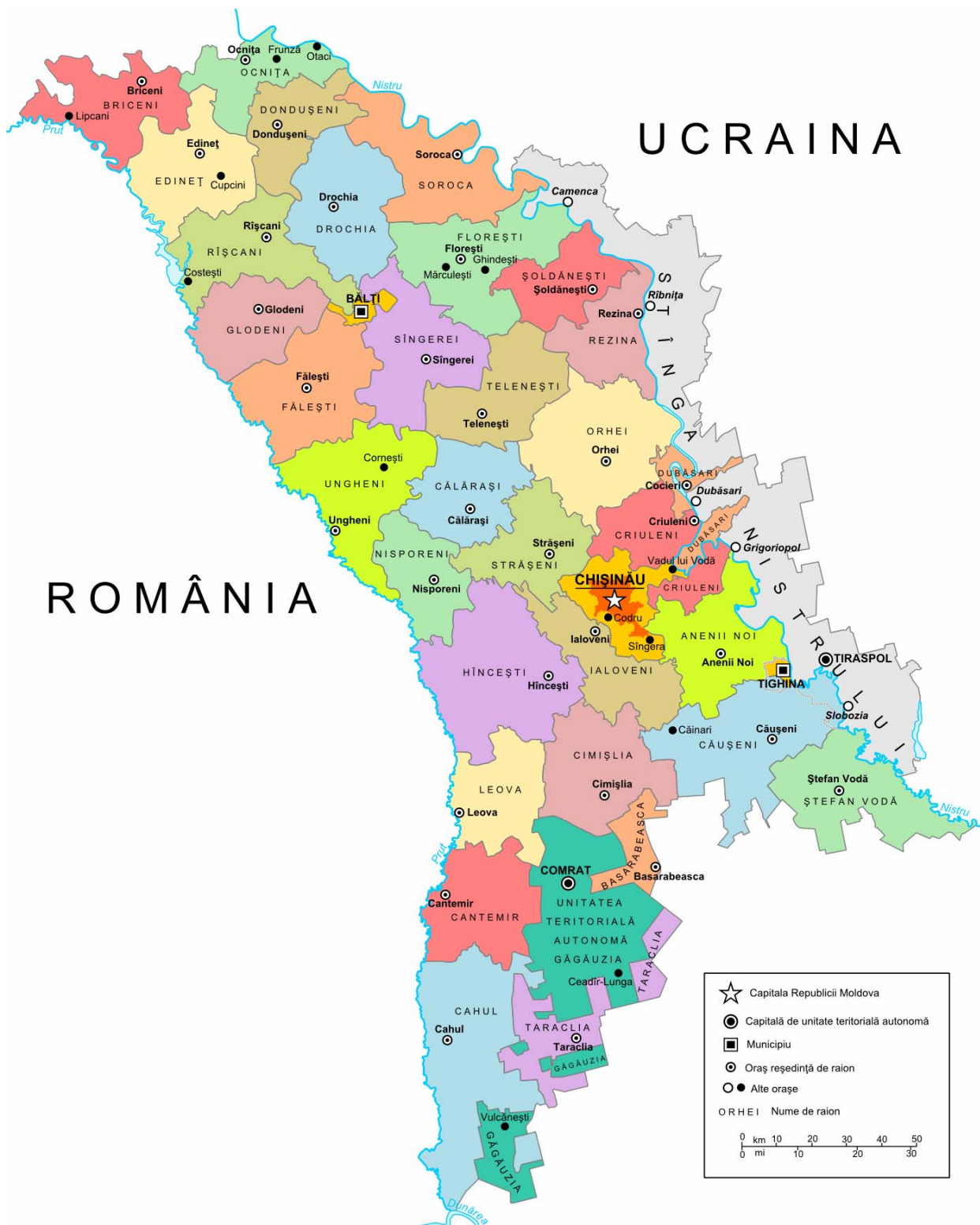
Harta editată la Chișinău.