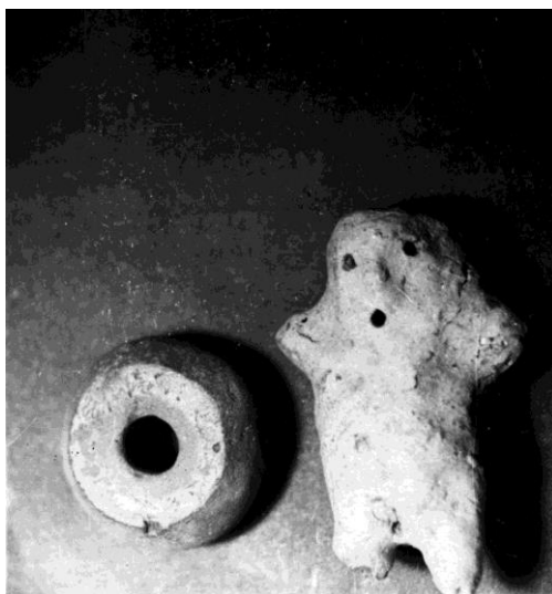
Рис.2. Антропоморфная статуэтка (1), пряслица (2).

Одной из наиболее интересных находок, найденных на поселении, является глиняная антропоморфная статуэтка (Рис.2/1). Изготовлена из теста с примесью шамота. Обжиг хороший. Выделены голова, руки, ноги (одна сломана). Глаза, рот, анальное отверстие обозначены круглыми углублениями. Нос обозначен щипком. Длина статуэтки 7 см. Наиболее близкие аналогии этой статуэтки известны на гетском поселении в с. Ханске [1]. Найдено также глиняное пряслице (Рис.2/2) диаметром 4 см, диаметр отверстий 1 см, высота пряслица 2 см. По форме пряслица биконическое и относится к первому типу гетских пряслиц, выделенных И.Т. Никулицэ [2].