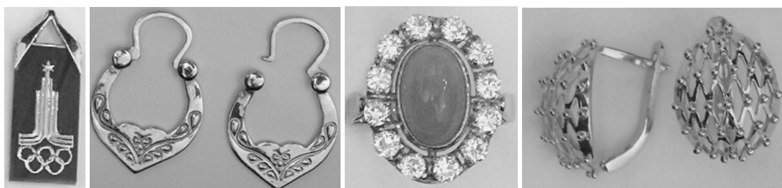
Fig.2. Pandantiv cu simbolică olimpică. 1980. Aur; Cercei moldovenești, aur, titlul 583; Inel . Aur, zirconiu, crisopraz. Premiul II al „Ювелирпром”-ului la 1975. V.Vasilkov; Cercei-plasă , aur. Uzina de bijuterii din Chișinău.